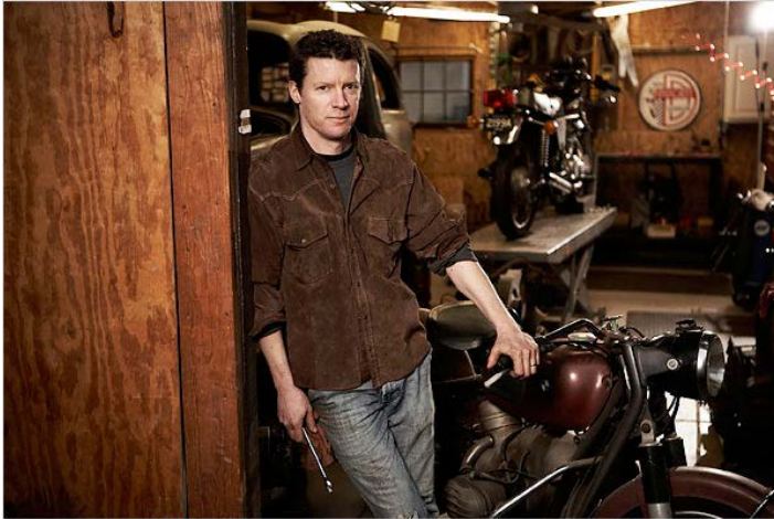
Mathew Crawford, Eloge du carburateur

Subordonner le bien intrinsèque d'une activité à des exigences extrinsèques.